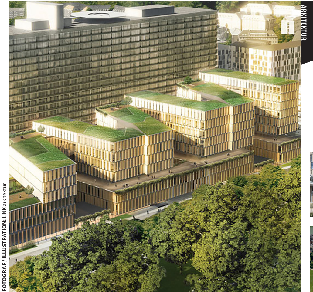
FOTOGRAF / ILLUSTRATION: LINK arkitektur

Byggeriet er en direkte forlængelse af Nordfløjen Fase 1, der er under opførelse som en del af Region Hovedstadens samlede Kvalitetsfondsbyggeri "Det Nye Rigshospital". LINK arkitektur er totalrådgiver på opførelsen af Nordfløjen Fase 1.